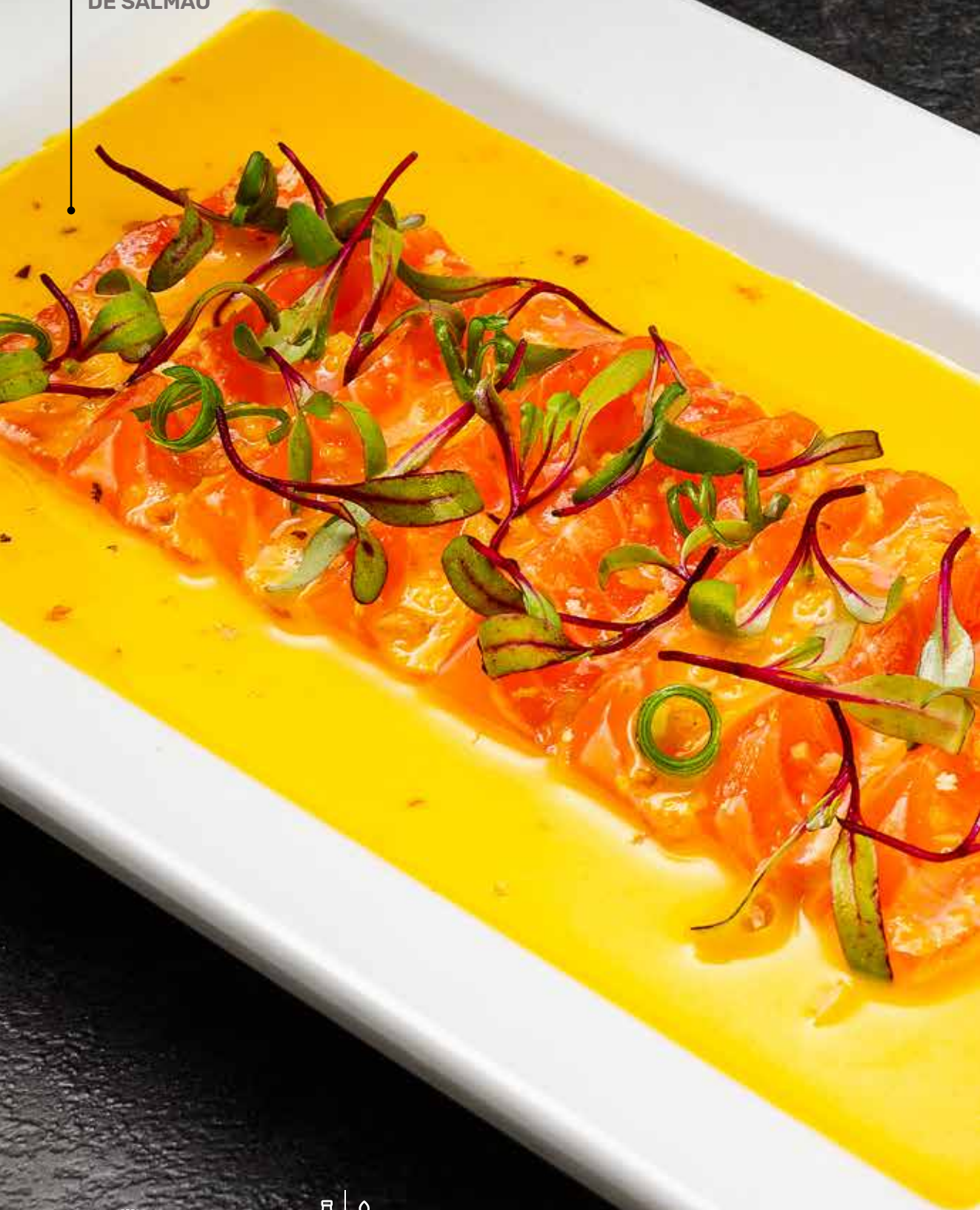
TIRADITO DE SALMÃO